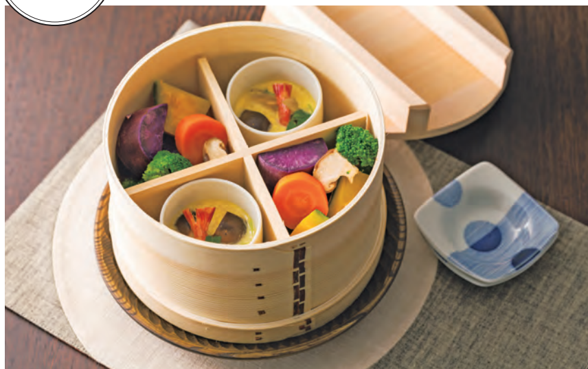
※茶碗蒸しの器(約φ7.5cm程度まで)も入れることができます。